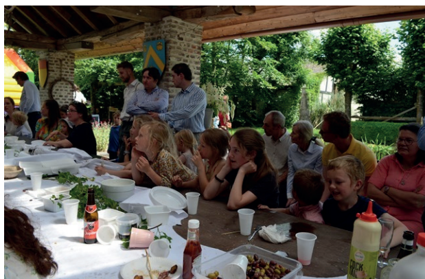
Parochiemaaltijd van de Sint-Amanduskapel (Gent) op zondag 23 juni.