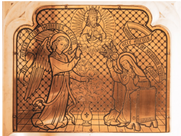
Detail koperplaat met afbeelding van de Blijde Boodschap.

Onder het altaarblad zijn in overeenstemming met het bovenste deel en ook met het hoofdaltaar opnieuw drie gegraveerde koperplaten aangebracht. Van links naar rechts zijn weergegeven, de heilige Jozef met winkelhaak, de heilige Anna, moeder van Maria weergegeven met haar kind en de heilige Joachim, vader van Maria.