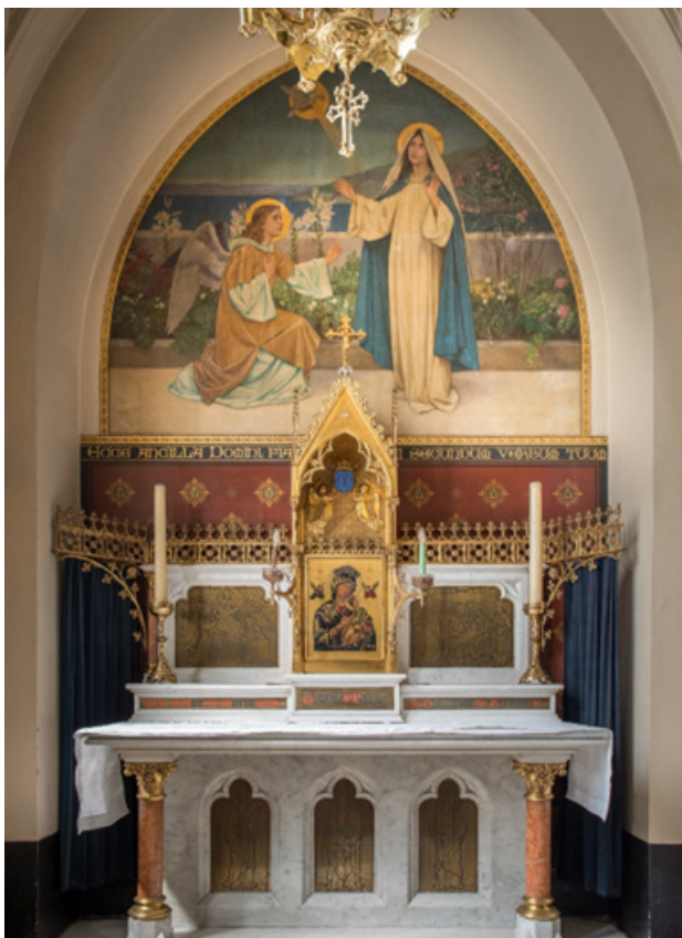
Zijaltaar in de Mariakapel.

Tussen het altaarblad en het tabernakel staat het begin van het Wees Gegroet: " Ave Maria gratia plena Dominus tecum. "