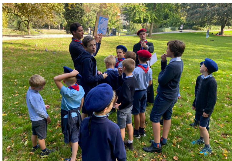
Maandelijks bijeenkomst van de E.K. in Antwerpen.