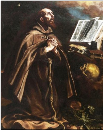
De H. Petrus van Alcantara mediteert.

Beste Kruisvaarders, dit puntje is prachtig en heel goed voor het leven van onze ziel, maar tegelijk ook een test voor diegenen die misschien de rang van Ridder in de Eucharistische Kruistocht nastreven. Dat is iets heel goed. De rang van Ridder is edel. Enkel de moedigsten kunnen deze speld ontvangen. Eén van de dagtaken van de Ridder is elke dag 15 minuten te overwegen. Wie dus in de maand februari en maart elke dag volhardt in dit Puntje, zou misschien Ridder kunnen worden.