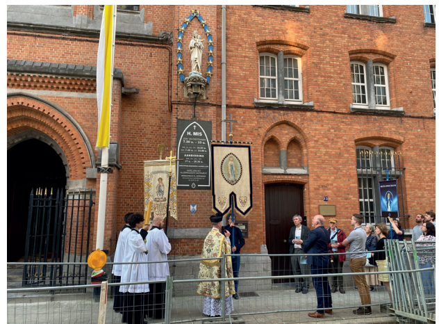
Mariahulde voor de maand mei.