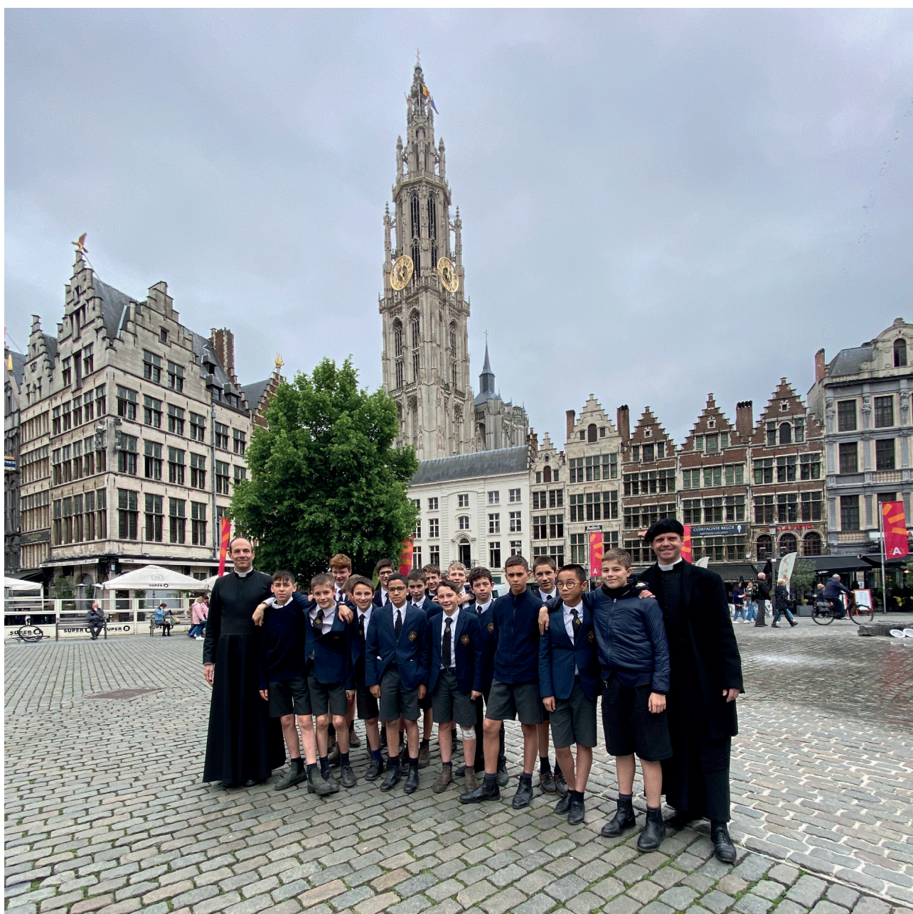
Twee dagen voor O.L.H.-Hemelvaart kwamen jongeren uit de school Saint-Jean Batiste de la Salle van Camblain (Aras) voor twee recollectiedagen ter voorbereiding van hun plechtige communie.