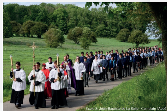
Ecole St-Jean-Baptiste de La Salle - Camblain l'Abbe

APEC ASBL BNP PARIBAS FORTIS IBAN : BE86 2100 0476 2550 BIC : GEBABEBB